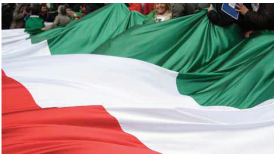
Manifestazione in difesa della Costituzione

La nostra Costituzione è ancora, in gran parte, da attuare. Le sue novità erano molte e profonde, se realizzate avrebbero portato a un sostanziale capovolgimento rispetto al passato; la trasformazione più consistente era legata alla realizzazione dei diritti sociali, a un nuovo rapporto fra le persone e fra le persone e le cose: l'inattuazione più grave riguarda appunto i diritti sociali. Così non è stato raggiunto l'obiettivo dei Costituenti di creare un mondo più umano, di costruire un sistema diverso di relazioni dei cittadini fra loro e con il potere, di consentire a tutti di vivere una vita "dignitosa", di essere